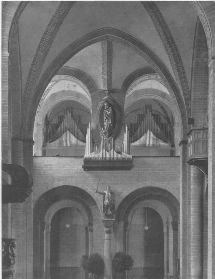
SOEST, PATROKLI - DOM