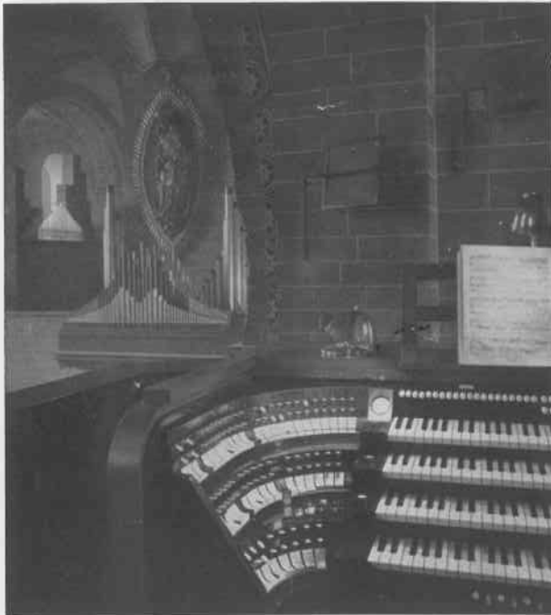
SOEST ORGEL VOM SPIELTISCH GESEHEN